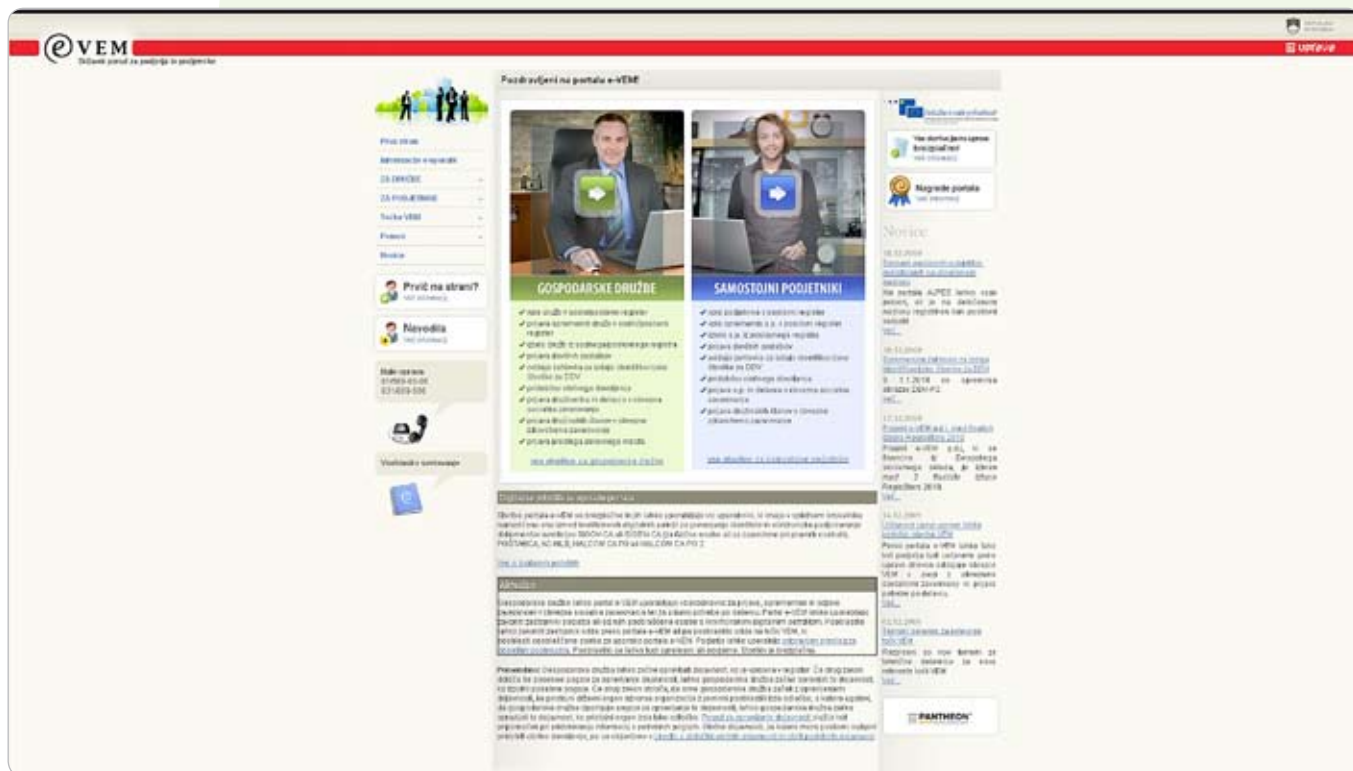
Slika 1: Portal e-DEM.

prebivalstva, registra prostorskih enot in poslovnega/sodnega registra Slovenije, možnost spremljanja stanja oddanih vlog in izvedbe postopkov preko portala, možnost takojšnjega elektronskega vpogleda v podatke lastnega podjetja, možnost elektronske vročitve sklepov.