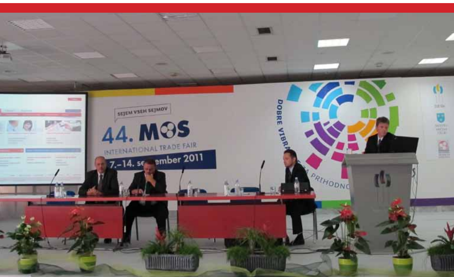
Slika 1: Dogodek na sejmu MOSS 2011.

Oblikovna in konceptualna zasnova starih spletnih mest Obrtno-podjetniške zbornice Slovenije je bila narejena daljnega leta 2004. Spletno mesto www.ozs.si je bilo zasnova kot informativni portal, preko katerega zbornica (enosmerno) obvešča svoje člane o aktualnih zadevah. Skozi življenjsko dobo je bilo spletno mesto večkrat nadgrajeno