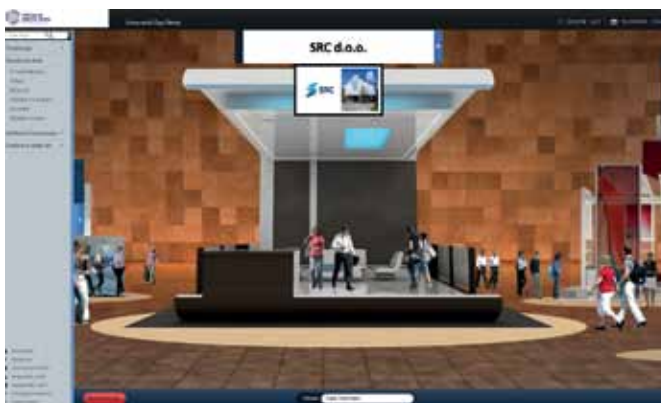
Slika 4: virtualnisejem.si.