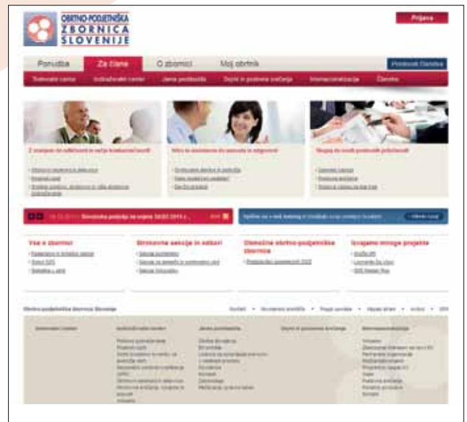
Slika 3: Spletno mesto.