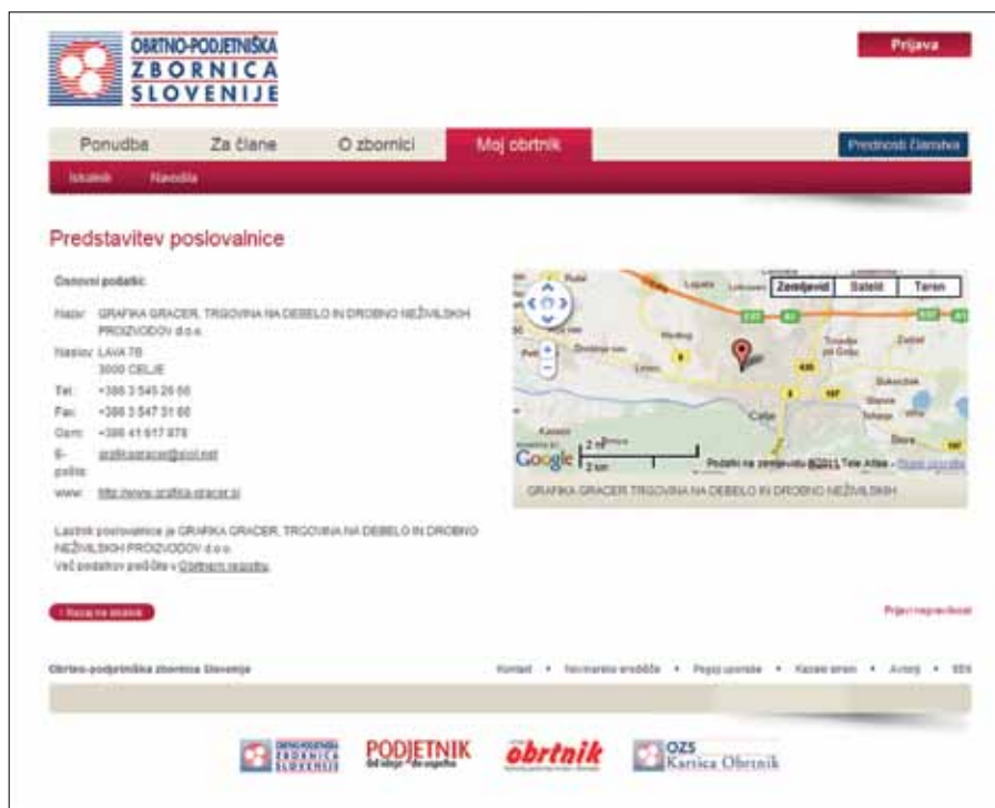
Slika 2: Moj obrtnik na spletu.

z manjšimi samostojnimi spletnimi aplikacijami in oblikovnimi dodatki, posledica česar je neenotna tehnološka platforma z veliko majhnimi samostoječimi aplikacijami. Poleg zastarelega koncepta in tehnološko neenotne in stare platforme pa ima zbornica problem tudi s samim obsegom in strukturo vsebin. Obseg članov je z leti narastel na več kot 25.000 in vse te vsebine so uvrščene v prvotno vsebinsko strukturo, le-ta pa je postala prenasršena in neuporabna.